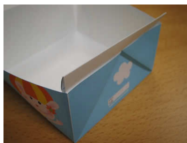
9. 残った先端も三角の袋の中に差し込み、もち手のかたちを整えます。