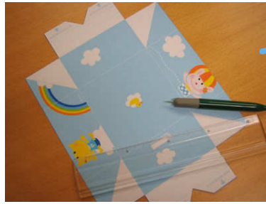
2. 鉄筆などで線をなぞり、折り目をつけておきます。