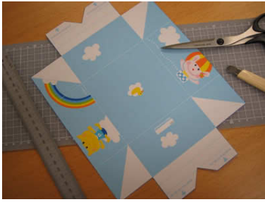
1. いちばん外の紺色の枠線で切ります。