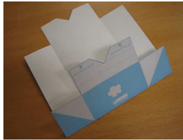
4. 下端を折り目のところで折ります。