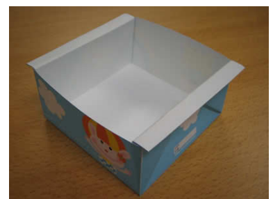
10. 上端も同じように折ったら、できあがり！

紙が一重なので、普通のコピー用紙で作るとぺこぺこしてしまいます。できればすこし厚めの紙でつくってください。