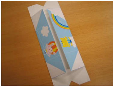
3. 左右の端を中心に向着いて折ります。しっかり折り目をつけたら開きます。