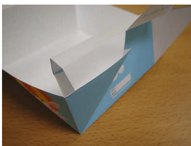
8. 下端を90度に立ち上げます。左端も起こし、6でつまみ出した三角の袋の中に、先端を差し込みます。