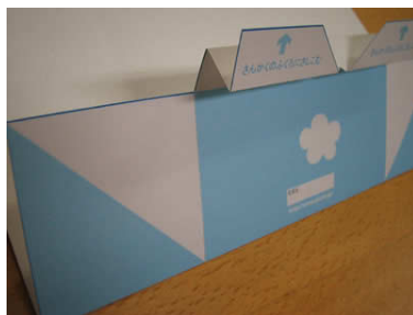
5. もち手になる部分を、ジャバラ状に折ります。