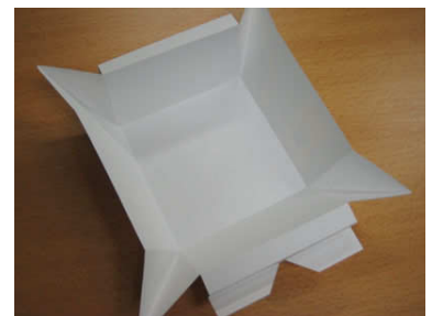
7. 上端も同様にします。これで、箱のかたちになるための折り目がすべてつきました。